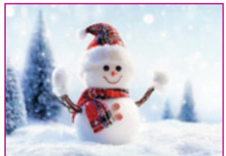
روز کریسمس در The Curve

اگر موفق به رزرو جا نشدید باز هم می‌توانید برای صرف قهوه و تنقلات به ما بپیوندید. بازی و سرگرمیهای زیادی برای کودکان کلیه سنین برنامه‌ریزی شده است و سانتا تا ساعت ۵ بعد از ظهر با ما خواهد بود. در ساعت ۴:۳۰ فیلمی برای کودکان پخش شده و برای همه هدایایی تقدیم خواهد شد.