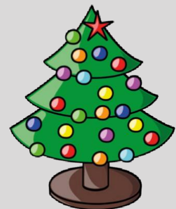
روز کریسمس در The Curve

اطلاعات بیشتر: www.lawsociety.org.uk/for-the-public/getting-expert-help/grenfell